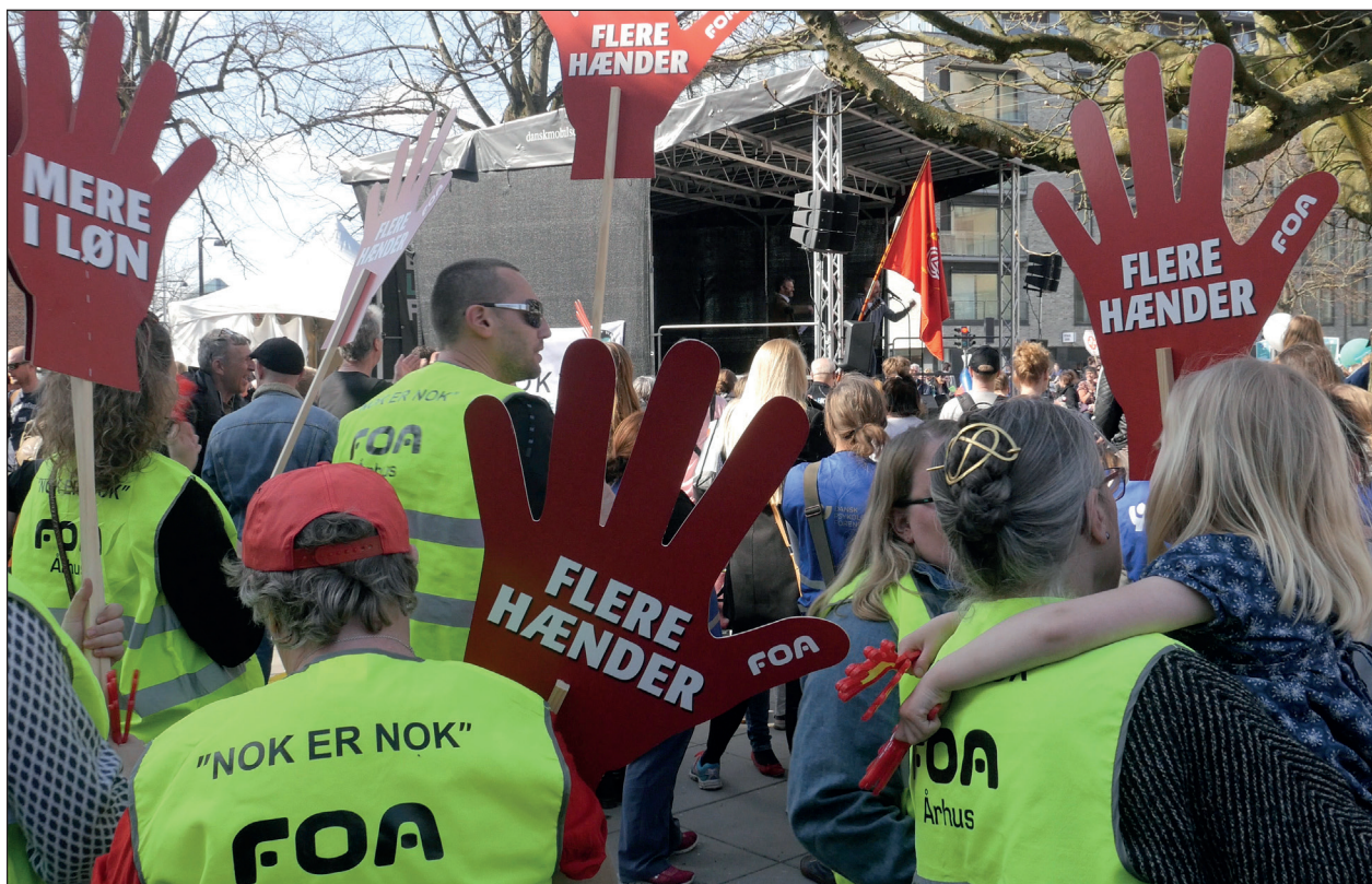
Det er en aktiv og samlet fagbevægelse – som her under OK18 - der kan forhindre mere fleksibel arbejdstid.

Arbejdsgivernes krav om mere fleksibel arbejdstid handler om, at de vil kunne planlægge folks arbejdstid med færre be-