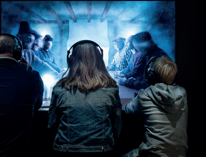
Fra middelalderudstillingen på Moesgaard Museum.